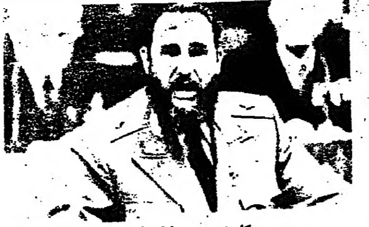
كاسترو يعيد تنظيم الدولة